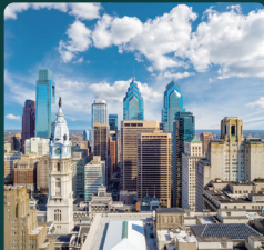
CPHI Americas 2026년 6월 2일 - 4일 미국, 필라델피아