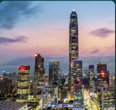
CPHI & PMEC Shenzhen 2026년 9월 16일 - 18일 중국, 선전