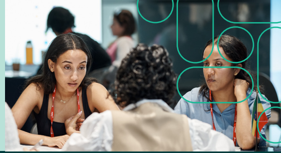
The Platz Hall