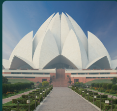
CPHI & PMEC India 2026년 11월 23일 - 26일 인도, 델리