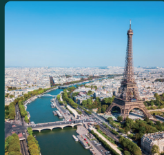
Pharmapack 2027년 1월 27일 - 28일 프랑스, 파리