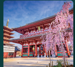
CPHI Japan 2027년 4월 21일 - 23일 일본, 도쿄