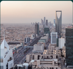
CPHI Middle East 2026년 5월 11일 - 13일 사우디아라비아, 리야드