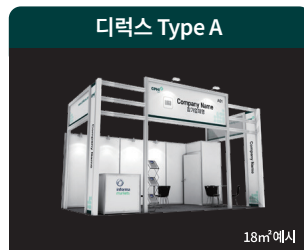
부스 상단 그래픽 제공