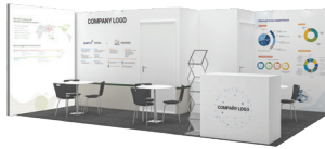
3개사 한정 단 1자리 잔여 2개사 계약 완료

단 세 기업을 위한 골드 스폰서십은 50인 네트워킹 해피아워 주최, 그래픽 지원, 제품 쇼케이스, C홀 천정 배너, 세미나 등 핵심적인 홍보 기회를 포함한 프리미엄 패키지입니다.