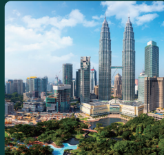
CPHI South East Asia 2026년 7월 8일 - 10일 태국, 방콕