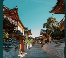
CPHI Korea 2026년 8월 25일 - 27일 대한민국, 서울