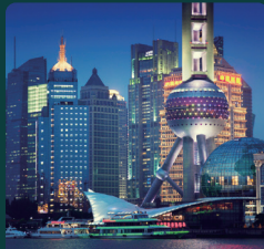
CPHI & PMEC China 2026년 6월 16일 - 18일 중국, 상하이