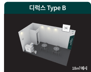
라이팅 박스 그래픽 제공

*상기 이미지는 C홀에만 해당되는 예시이며, 부스의 오픈 면수 및 주축 측 사정에 따라 변경될 수 있습니다