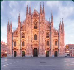
CPHI Milan 2026년 10월 6일 - 8일 이탈리아, 밀라노